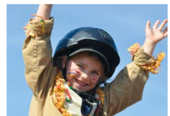
Gang-Art | INTEGRATIVES REITEN, VOLTIGIEREN & REITTHERAPIE