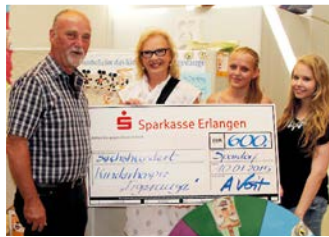
Ernst Pezold Schule