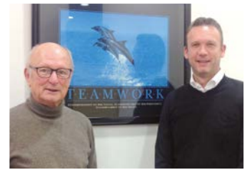
Dorsch + Leibl KLIMATECHNIK